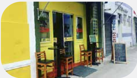
2º Paladar Nordestino ($) (200m de distância)