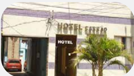
2º Hotel Carrão (2 estrelas) (230m de distância)