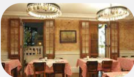
4º Speranza Pizzaria($$$) (290m de distância)