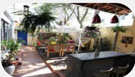
3º Pousada dos Franceses (2 estrelas) (400m de distância)