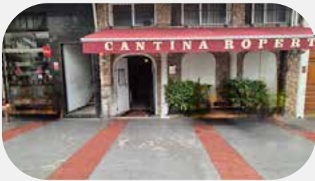
1º Cantina Roperto ($$$) (80m de distância)