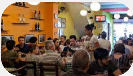
3º Cantina Mamma Celeste($$$) (210m de distância)