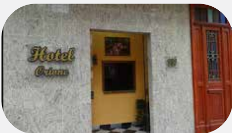
1º Oriane Hotel (2 estrelas) Em frente ao local do curso

As sugestões de hospedagem tem como critério apenas a distância. Valores e disponibilidade devem ser consultados diretamente com a hospedagem.